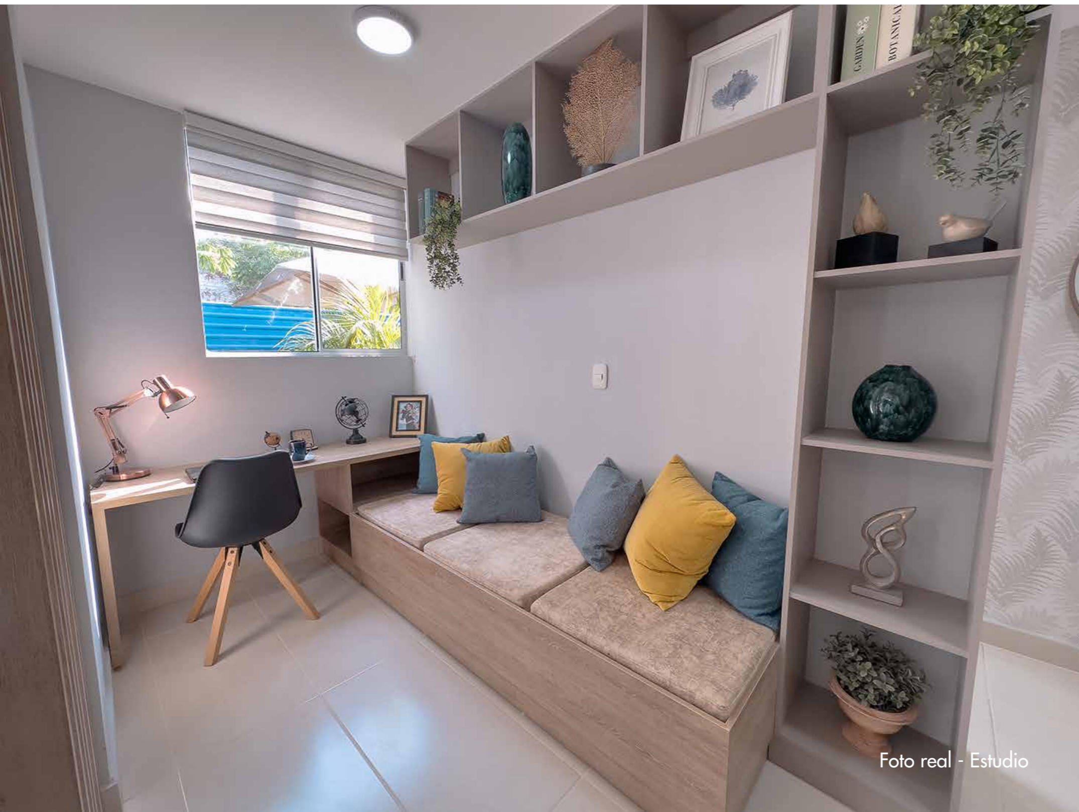
Foto real apartamento modelo de 56.76 m 2 área total