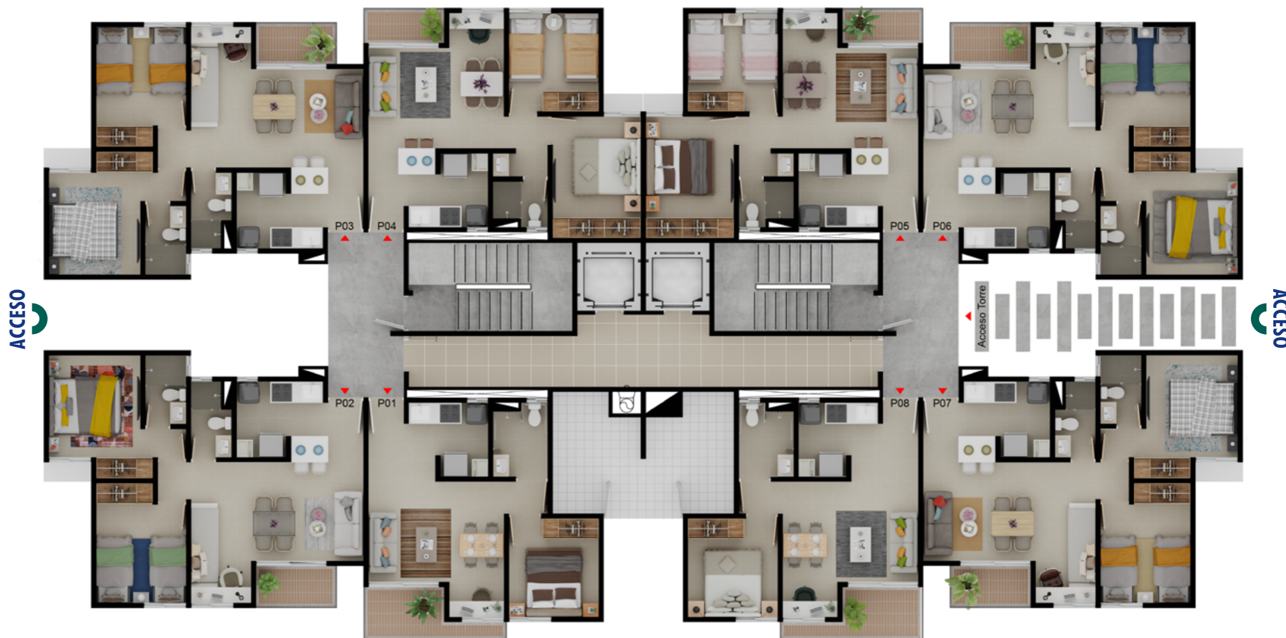
Vista al parque residencial

Todas las imágenes perspectivas y planos de esta publicación son ilustrativas e incluyen elementos y amoblamientos decorativos. El proyecto, la ubicación y tipos de torres de 56.76 m 2 , 48.32 m 2 y 40 m 2 ofrecidas pueden sufrir modificaciones, como consecuencia directa de órdenes dadas por la curaduría o la alcaldía competente en la expedición de la licencia de construcción, por caso fortuito y/o fuerza mayor.