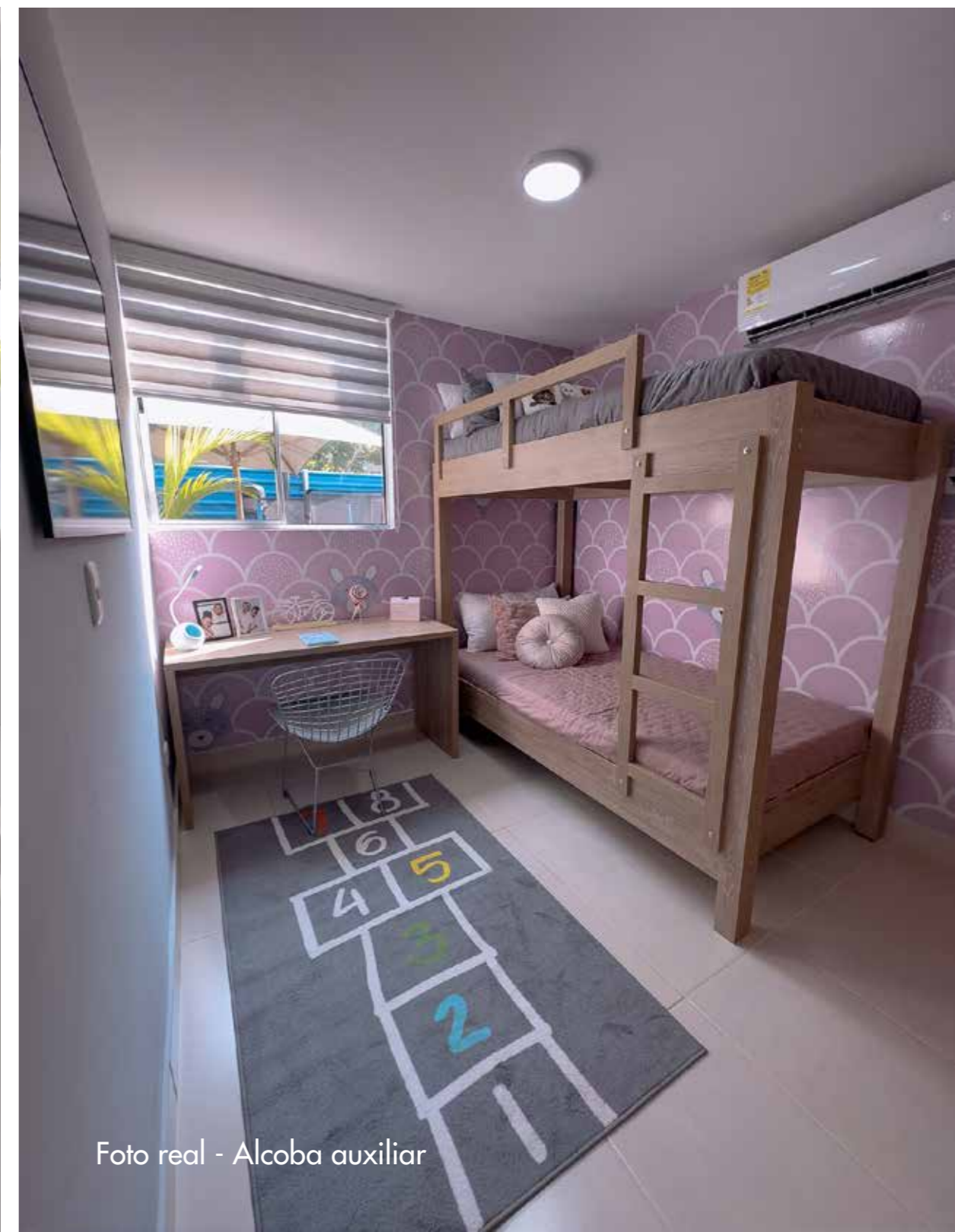
Foto real - Alcoba auxiliar