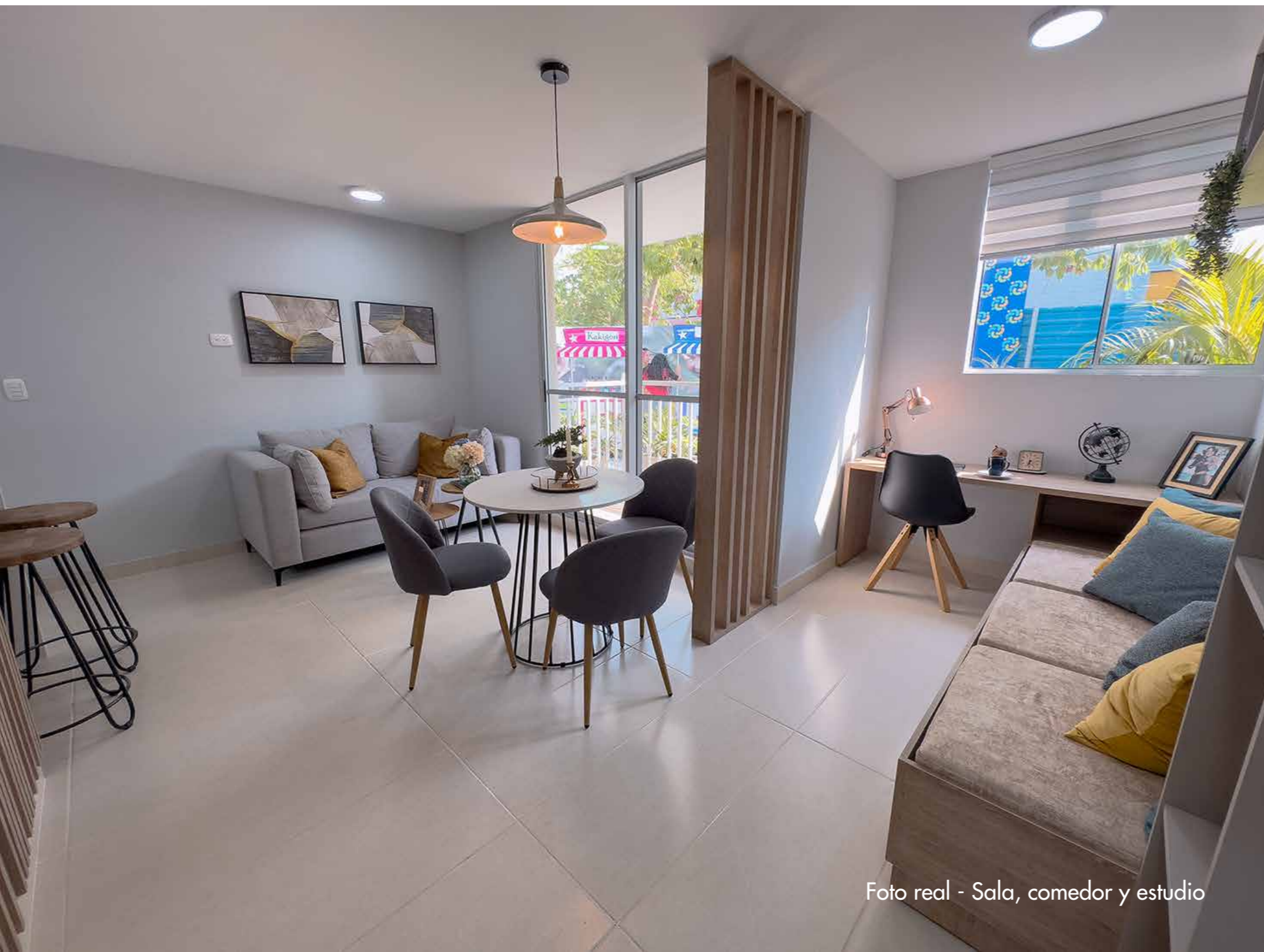
Foto real - Sala, comedor y estudio