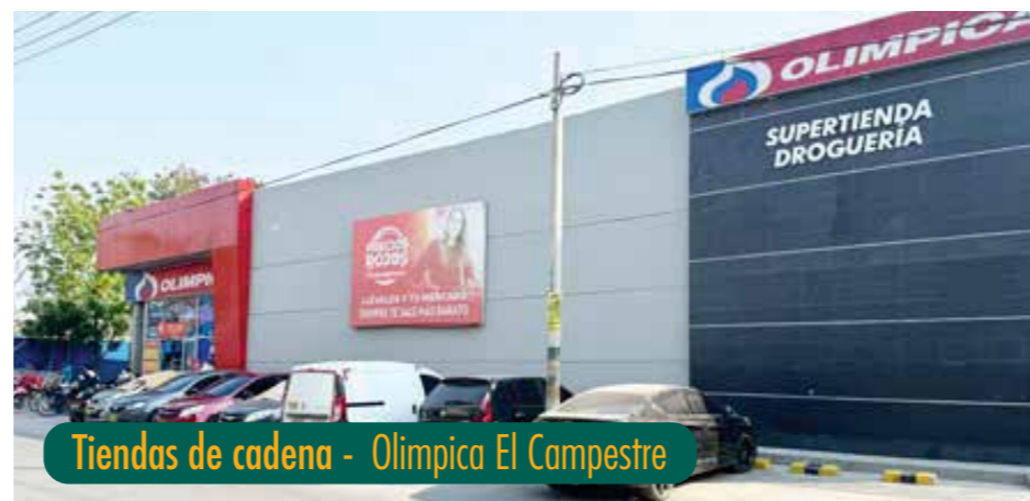
Tiendas de cadena - Olímpica El Campestre

Su locación sobre la amplia Diagonal 28, que conecta con la Vía Mamonal y la Avenida Crisanto Luque, lo convierte en un punto estratégico a pocos minutos de la Ciudad Amurallada.