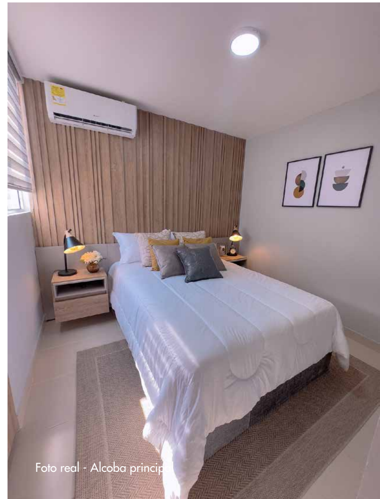
Foto real - Alcoba principal