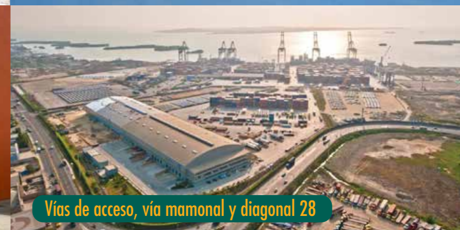
Vías de acceso, vía mamonal y diagonal 28